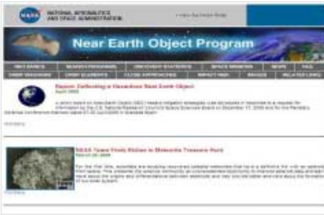
مالپهری بهرنامه ی تمه نیزیکه کانی زهوی