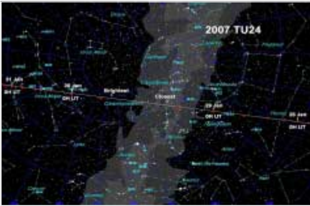
هماران نيزدک و هساروکه لمریزر چاودیزی فلهکناسانن