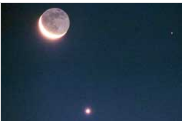
له 2009/8/27، مهربخ له نيزکترین خالدا وهک نه ستریه کی گش بهدیار دهکویت

جیسهان بلاو دهکرتنهوه و هیواداریشین دهزگاکانی بهریزی راگه یاندن - نهوانه ی تمه جزره هوالانه بلاوده کنهوه- به ورده کاریتری زور زیارت مساهله له گهل نهو زانباری و هوالانه بکن که له ریگای سهرچاره جیاجیاکاندا بدهستیان دهگات ،وازانم هیچ زانباری و راستییه کیش لهوه کاریگرتر سهرنجراکیشانه بز مالپه ی و گوفار و نهوانه ستریه کی گش بهدیار دهکویت