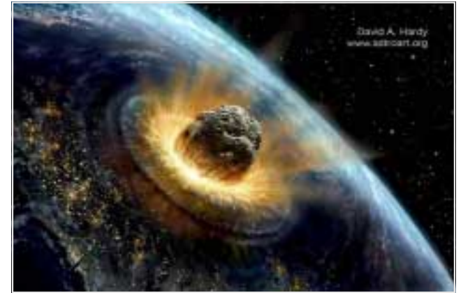
تابلیزهکی دسکرد بز نگره ی بهرکوتن بهزی هساروکه یک