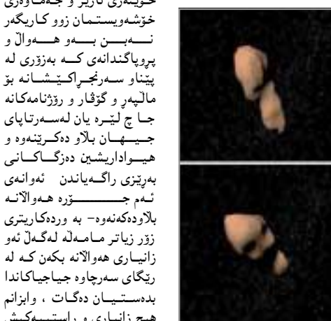
هیلکاری نریک کومته وه ی هه سا ری مریخ له گه ل زهوی

ئه مه ش یه کی که له و پرۆیا گنده ناراستانه ی که خیرا له نیتیه ده زگاکانی راگه یاندندا پیتیه که توتاتیس بۆ ته نه ئاسمانیه تیه که رهنگه هه ره شه بۆ زهوی بنیتیه وه و ناسراوه به «به رنامه ی ته نه نیکه کانی زهوی NEO n». به پیتی دوا یین لیتدوانی زانایانی نیتیه ئه م به رنامه یه، هیچ جۆره بهرکه وتنیک روونادات له نیتوان زهوی و هه سا ره کی TOUTATIS که گوايه له سالی 2012 بهر رووی زهوی ده که ویت و ته رو هیشک پیکه وه ده ست نیتیت. له کۆتاییدا هیوادارین که وا خوینهری نازیز و جه ما وه یی خۆشه و یستمان زوو کاریگه ر نه یسن به هه و ال و پرۆیا گنده نی که به زۆری له پیتنا و سه رنجرا کتیشانه بۆ مالبه ی و گۆفار و روژنامه کانه جا ج لیره یان له سه رتا پای جیهان پلا و ده کرتیه وه و هیوادارین ده زگاکانی بهر تیزی راگه یاندن ئه وانه ی ئه م جۆره هه و الانه پلا و ده کرتیه وه- به ورده کاری تری زۆر زیاتر مامه له له گه ل ئه و زانبا ری هه و الانه بکن که له ریتگی سه رچاوه جیا جیا کانداه ده ستیان ده کات، و ابزانم هیچ زانبا ری و راستیه کیش له وه کاریگه رتر نییه ئه گه ر هاتوو به به لگه ی روون و ناشکرا پشت ئه مستور کرابن.